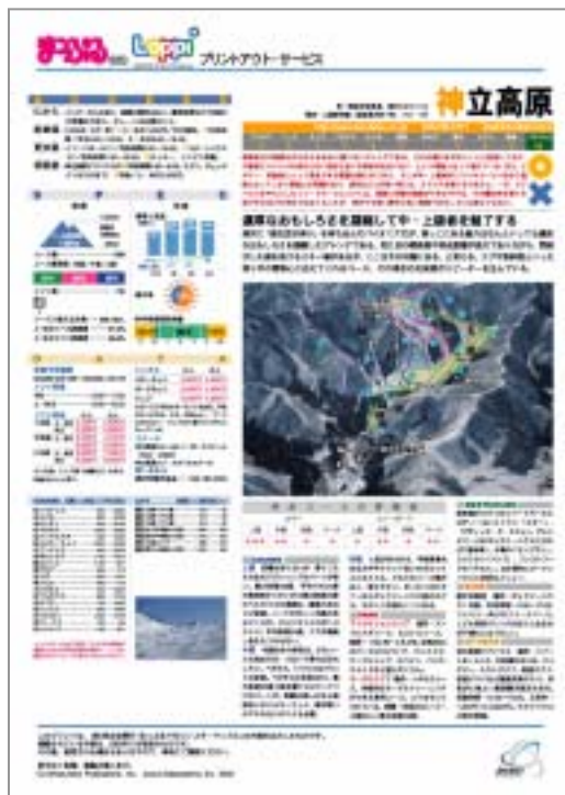
スキー場ガイド(1枚200円)